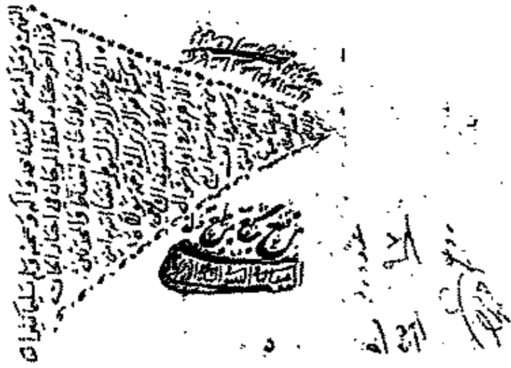
الصفحة الأخيرة من المخطوط (رقم ٥)